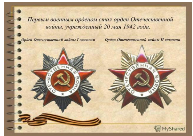
80 лет назад учрежден орден Отечественной войны I и II степеней (1942).