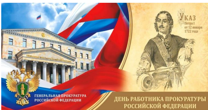
Российской прокуратуре 300 лет Указ Петра I от 12.01.1722 г.