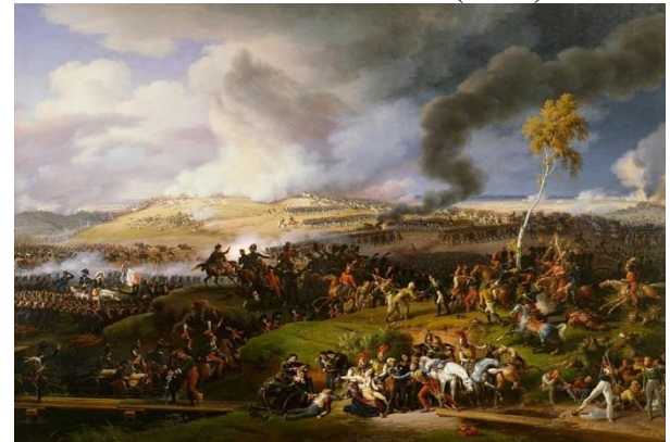
210 лет Бородинскому сражению в Отечественной войне 1812 года.