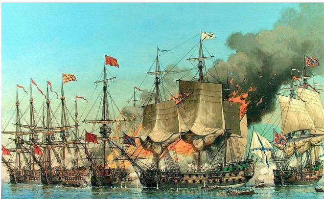
252 года со дня блестящей победы русского флота над турецким флотом в сражении в Чесменской бухте (1770 г.)