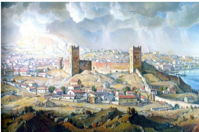
2551 год с основания Феодосии. Древняя Кафа

30 декабря 1922 г. в Москве открылся I съезд Советов СССР. Он принял Декларацию и Договор об образовании СССР. 100 лет со дня образования Союза Советских Социалистических Республик (СССР)