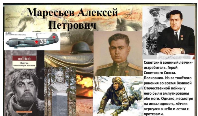
80 лет подвигу (1942) легендарного летчика А.П. Маресьева (1916-2001).