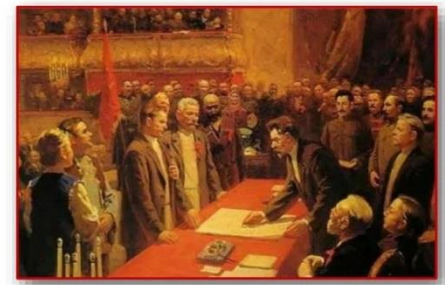
I съезд Советов СССР

30 декабря 1922 г. в Москве открылся I съезд Советов СССР. Он принял Декларацию и Договор об образовании СССР. 100 лет со дня образования Союза Советских Социалистических Республик (СССР)